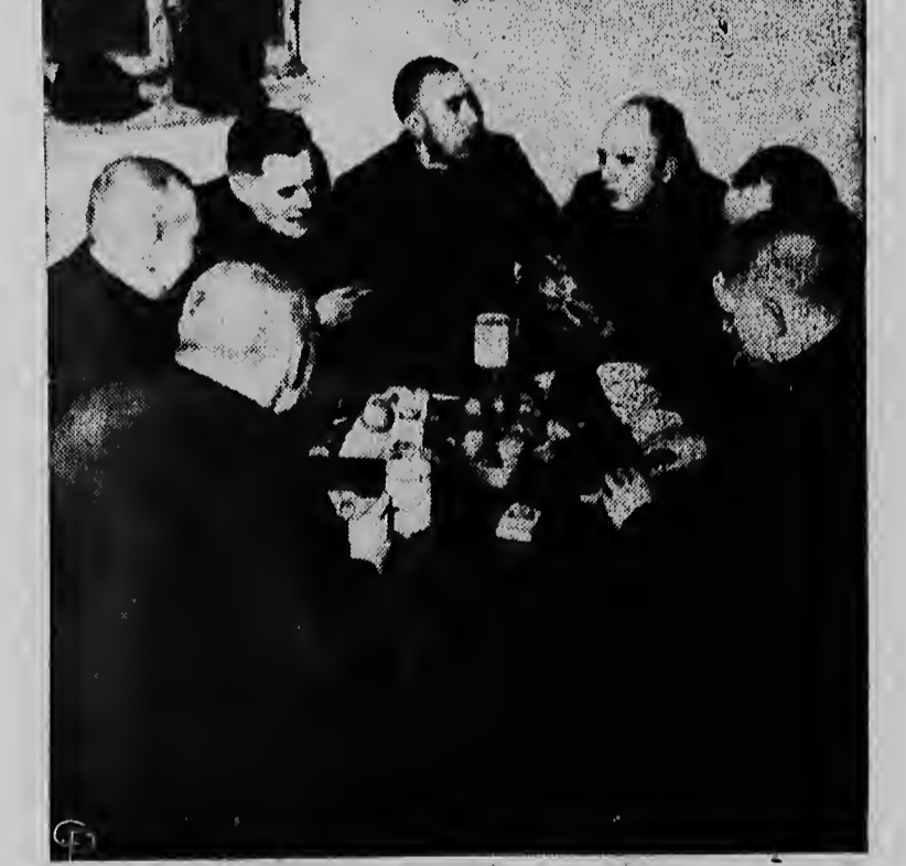
De krijgsgevangen Amerikaanse piloten (de communistische Chinese regering noemt hen spionnen) verblijven in een gevangenis „ergens in China“. Het aanbod van Peking aan de familieleden der gevangenen om een bezoek aan de spionnen te brengen, is door de familieleden en bioc afgeslagen. De secretaris-generaal van de Verenigde Naties Dag Hammarskjöld nam bovenstaande foto mee van zijn bezoek aan premier Tsjoe en Lal, dat was het enige dat hij had kunnen bewerken.

Veroordeeld tot 16 jaar dwangarbeid „wegens oorlogsmisdaden“. Later werd hij vrijgelaten op voorwaarde dat hij in zijn geboortedorp Krasic zou blijven.